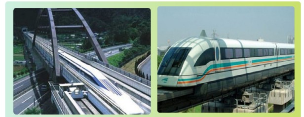
〈 일본의 초고속 자기부상열차 〉 〈 상하이 자기부상열차 〉