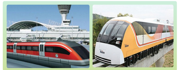
〈 원현 공항 노선용 자기부상열차 〉